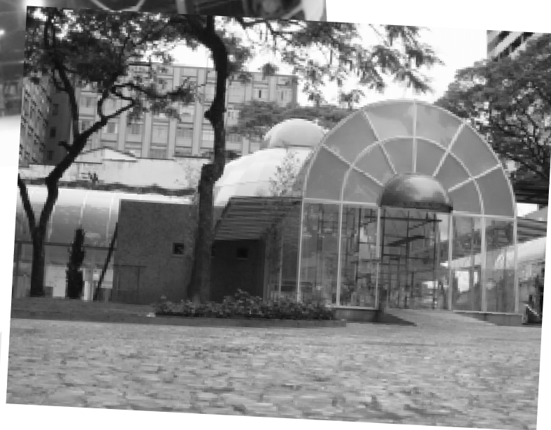
Espaço das Artes Zélia Arbex na Vila Santa Cecília