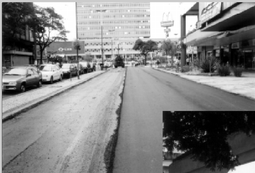
Recapeamento asfáltico nas ruas da Vila Santa Cecília