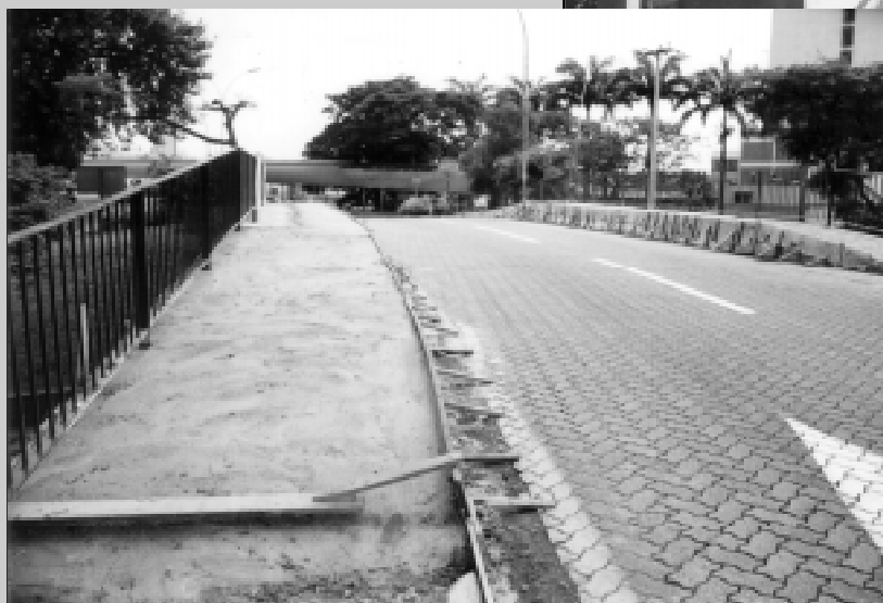
Ampliação de passarelas de pedestres no anexo do viaduto N. Sra. das Graças

O governo municipal está trabalhando com determinação para a entrega de todas as obras previstas até o final de dezembro/2004, como um presente e ato de justiça para a população, em prol da qualidade de vida dos moradores. Um pacote de 145 obras públicas importantes está sendo entregue pela administração municipal. Somente nos investimentos na ampliação do sistema de abastecimento e distribuição de água, nos bairros Água Limpa, Cidade do Aço, Nova São Luiz, Santo Agostinho, Vila Brasília, Complexo Roma (com financiamento do Governo Federal), São Luiz, os investimentos totalizam R$ 16 milhões. É o fim da falta de água nos próximos 50 anos.