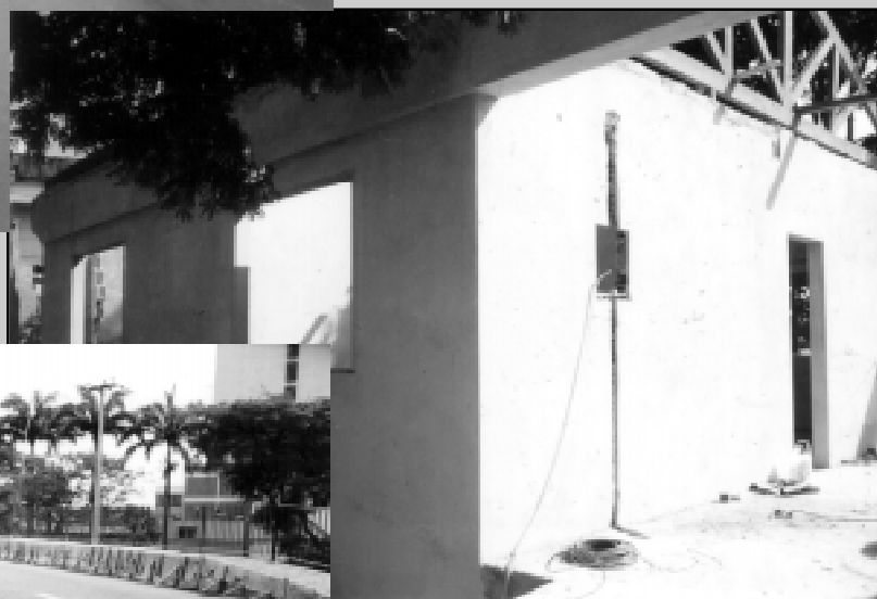
Construção do Centro de Ação Comunitária no Jardim Ponte Alta